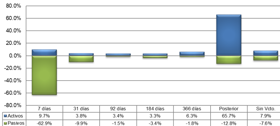
Perfil de Vencimientos en MN

La brecha de liquidez negativa en el horizonte de un mes decae a 297,723 MDP, es decir, 24,014 MDP menos que el nivel registrado el trimestre anterior por 321,737 MDP.